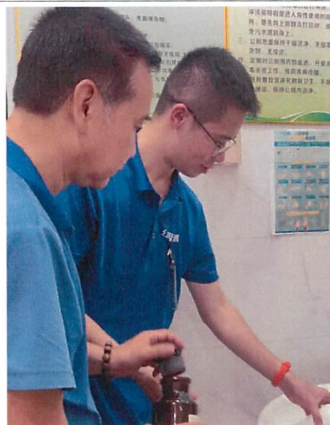
图 2：南山社区党群服务中心采样口