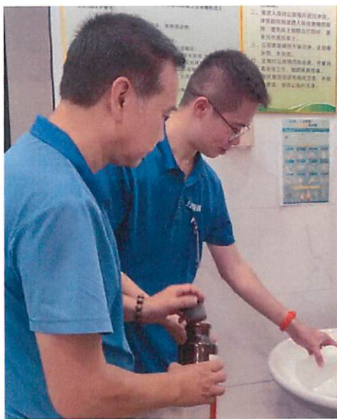
图 1：南山社区党群服务中心采样口